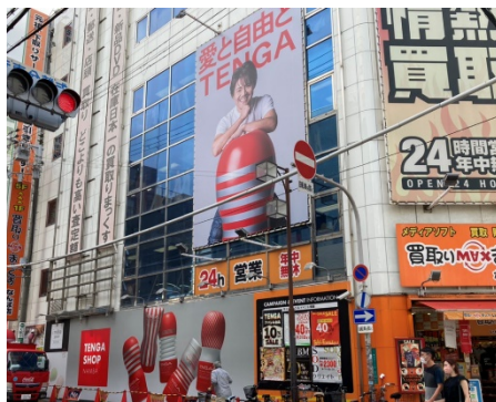
買取りMAX大阪日本橋の広告