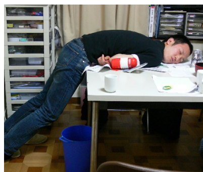
TENGA創業当時の社内の風景