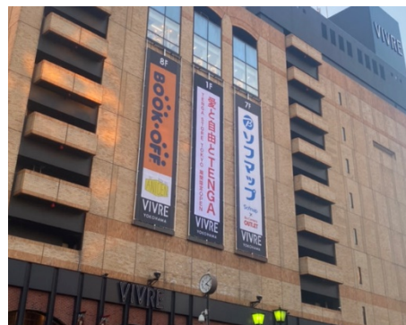
TENGA STORE TOKYO POP UP STORE 展開時に掲げられた横浜ビブレの懸垂幕