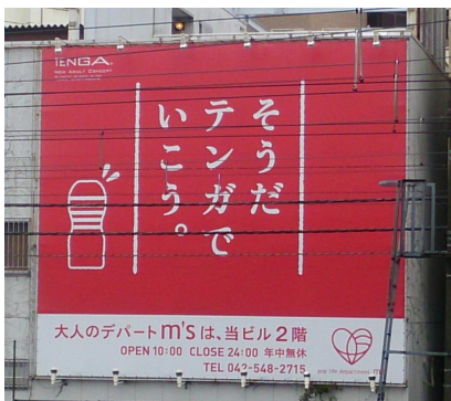
大人のデパート エムズの広告