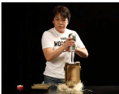
TENGA WORKOUT GEAR発売 筋トレとオナニーを1つに