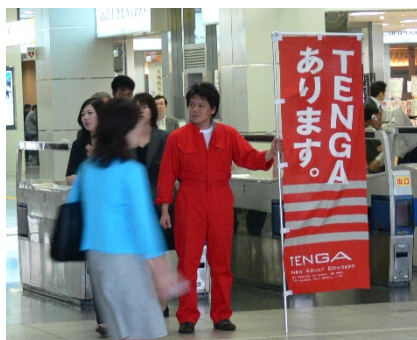
TENGAの実演販売で日本各地へ